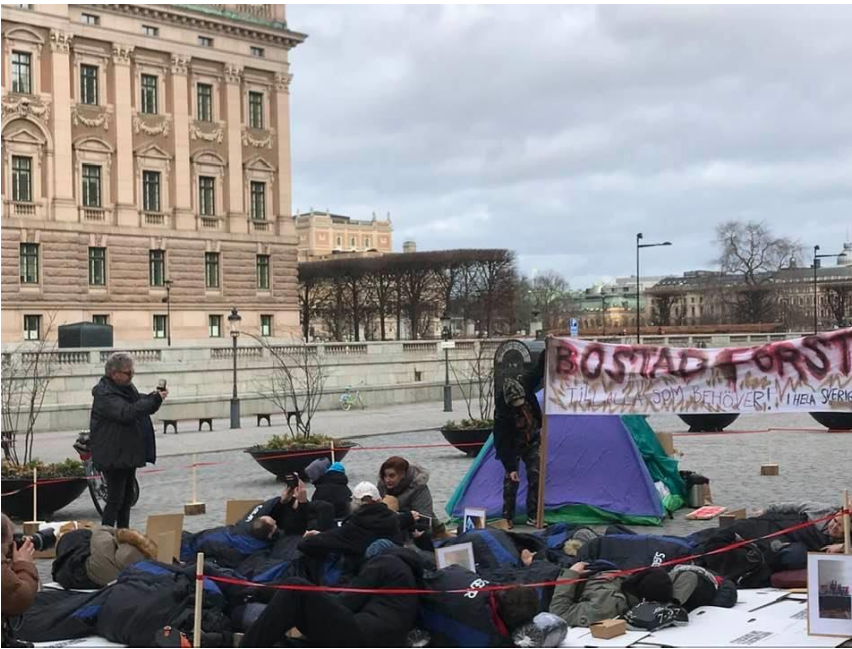
Foto: Människor i hemlöshet demonstrerar för Bostad Först på Mynttorget, Stockholm, februari 2020.