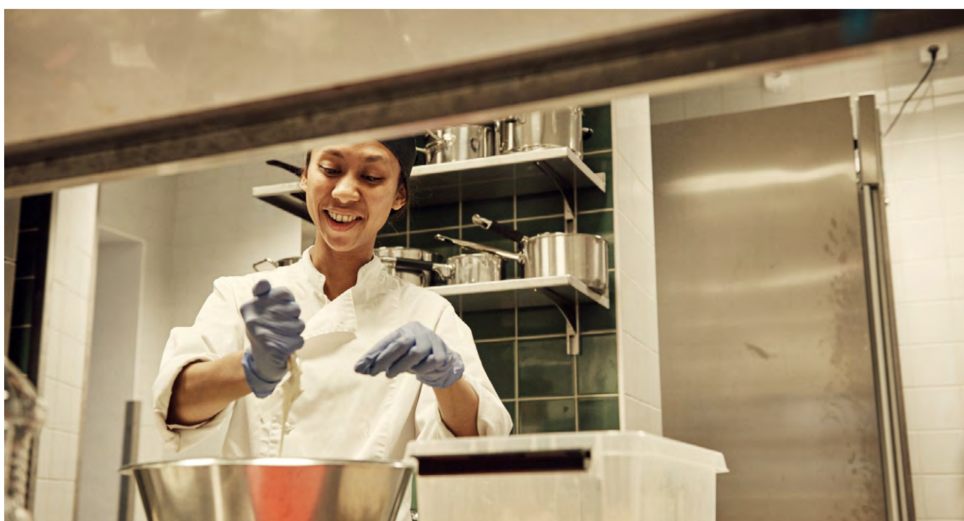
Matlagning på matsvinn i Stadsmissionens restaurang på Drottninggatan 33 i Göteborg.

På senare år har frågan fått ökad aktualitet i många välfärdsländer i efterdyningarna av den ekonomiska krisen 2008. Osäkerheten kring tillgången på mat, mätt i hur hushållen hade råd att hålla sig till rådande rekommendationer på området, ökade i Europa mellan åren 2008 till 2012 och ses nu som ett akut hälsoproblem, med betydelse för psykisk ohälsa, förmågan att hantera kronisk sjukdom och spädbarnsdödlighet. Den svenska situationen kring matfattigdom är alltså inte unik. Men att den drabbar ett land med så höga välfärdsambitioner som Sverige är anmärkningsvärt.